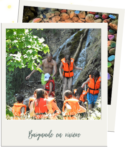
Baignade en rivière