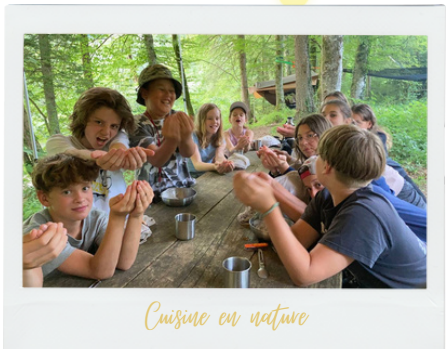
Cuisine en nature