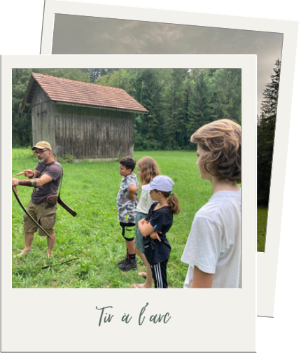
Tir à l'arc