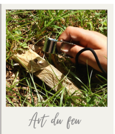
Art du feu